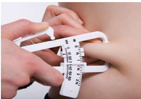
CALIBRADOR DE PLIEGUES O LIPOCALIBRE

- Respecto al material antropométrico básico debe requerir las siguientes características (Álvaro Cruz, 2010): Báscula o pesa, tallímetro de pared, calibrador de pliegues o lipocalibre, Cinta métrica de diámetros, Lápiz o marcador borrable demográfico: para la señalización de los puntos anatómicos y referencias antropométricas. Se marcan las zonas a medir como lo muestran las imágenes.