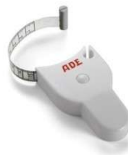
CINTA METRICA PARA PERIMETROS